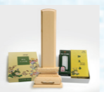
白木位牌 線香ローソク