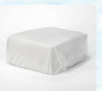
ドライアイス 1日分