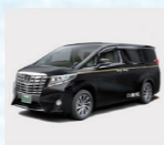
沼津市斎場までの 霊柩寝台車