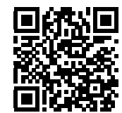
キャンペーンページ

お問合せはキャンペーンページ https://afterhome.jp/company-limited-campaign/ または、お電話・公式LINEから