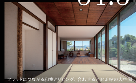
フラットにつながる和室とリビング、合わせると34.5帖の大空間

歴史を重んじ、革新的なデザインを 周囲の外部環境を積極的に取り込んだお住まいです。外観は軒の深い大屋根や庇により強い日差しを遮る日本家屋的な趣を持ち、室内は大膽に配置された大開口の窓から美しい庭の景色が広がる開放感に満ちた空間となっています。