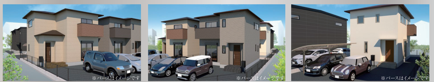
A棟 3LDK 敷地面積/148.98m 2 建物床面積/81.36m 2 B棟 3LDK 敷地面積/146.31m 2 建物床面積/85.29m 2 C棟 3LDK 敷地面積/182.13m 2 建物床面積/101.95m 2

選ばれる賃貸見学会の詳細や最寄りの窓口でのご相談、賃貸経営・土地活用の資料のご請求はこちらへ www.misawa.co.jp/totikatuyo/ ミサワ資産活用 検索