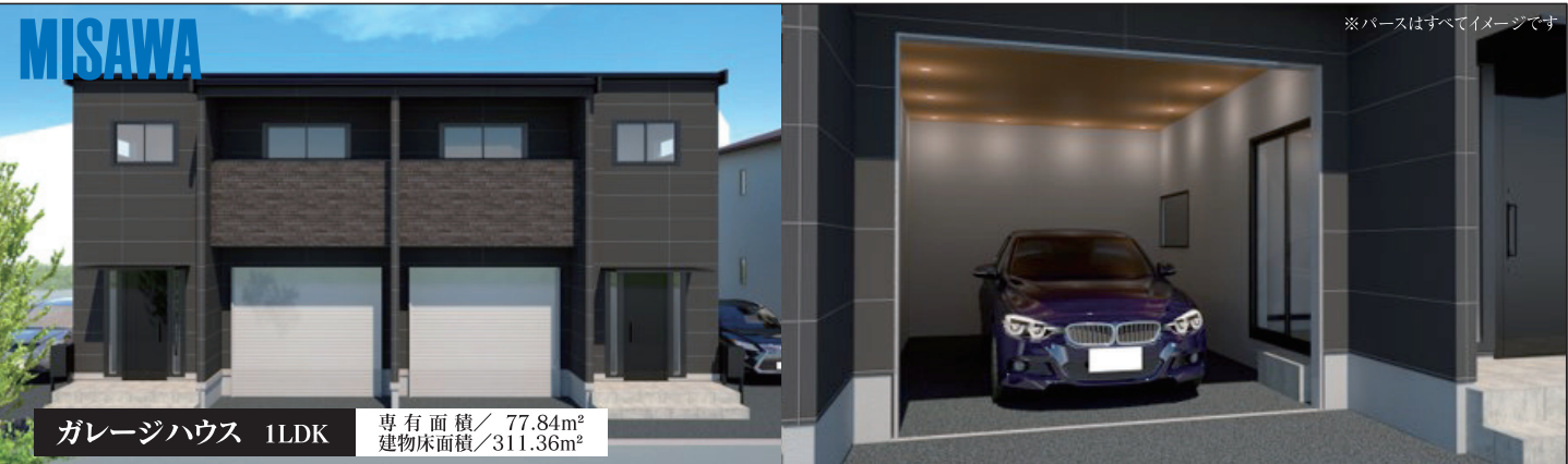
ガレージハウス 1LDK 専有面積/77.84m 2 建物床面積/311.36m 2